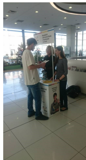
Prvý potencionálny záujemca, ktorý sa pristavil pri našom stánku

V nedeľu dňa 08.04.2018 sa naša škola prezentovala v Obchodnom centre Galéria Mlyny v Nitre. Návštevníkom centra sme ponúkali propagačné letáčky o možnostiach štúdia na škole a aktivitách pre žiakov. Záujemcom boli poskytnuté odborné informácie o štúdiu a zodpovedané ich otázky, ktoré sa týkali podmienok štúdia na Súkromnej strednej odbornej škole polytechnickej DSA v Nitre.