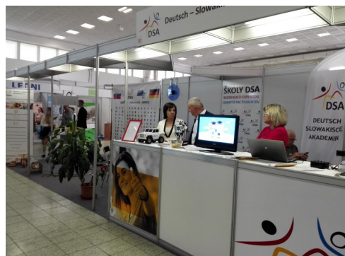
Prezentácia stredných odborných škôl DSA na výstavisku Agrokomplex

V rámci výstavy sme sa zapojili do súťaže „Inovácia a technická tvorivosť“ so súťažným výrobkom s názvom – Auto na diaľkové ovládanie.