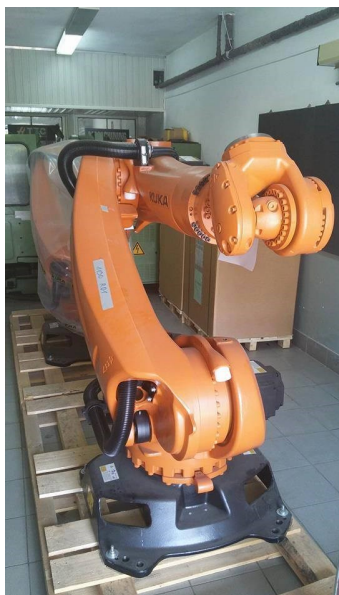
Prvé dva roboty zn. KUKA, ktoré sa od septembra budú využívať v učebnom procese.

Náš zriaďovateľ pre nás zabezpečil prvé roboty KUKA, ktoré pracujú priamo vo výrobe. Dňa 12. 06. 2018 sme ich priviezli do našej školy. Okrem štandardných robotov si teda budeme môcť vyskúšať aj tie veľké, ktoré sa používajú v reálnej výrobe. Pretože na kvalite výučby nám záleží a snažíme sa zvýšiť odbornú zdatnosť našich žiakov.