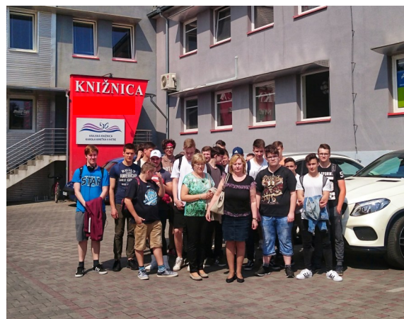
Žiaci prvých ročníkov pred Krajskou knižnicou v Nitre